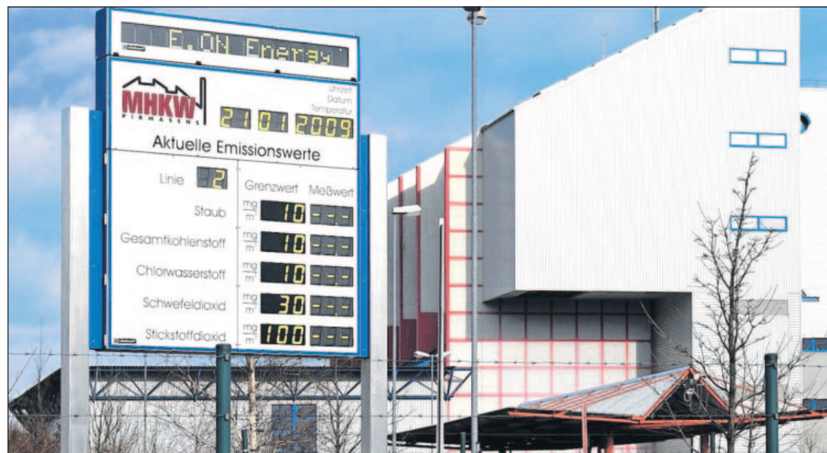
Liegt direkt an der B 10 und im Stadtteil Fehrbach: das Müllheizkraftwerk Pirmasens.